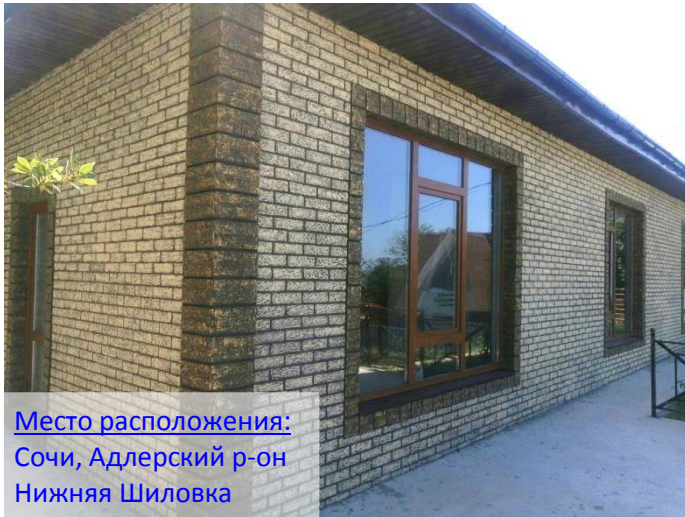
Место расположения: Сочи, Адлерский р-он Нижняя Шиловка